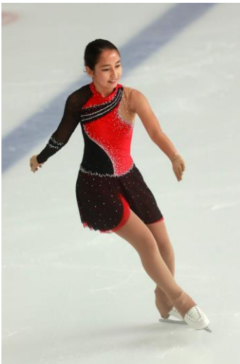
Kategorie Interbronze Mädchen